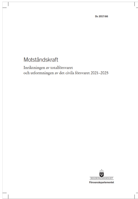
(Försvarsdepartementet, Ds. 2017:66)